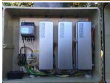
画像:経済産業省 (PCB使用安定器について)